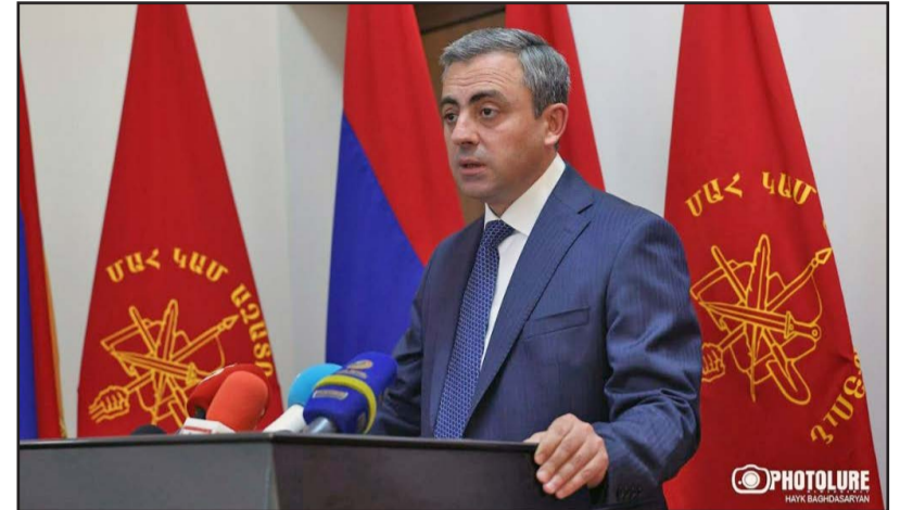
Մեծ ուժ կարենայ հաւաքել 49 տոկոսի ձայն, սակայն իշխանափոխութիւն տեղի չունենայ «մենք դա պարտութիւն կը համարենք»: Ան նշեց, որ «Հայաստան» խմբակցութեան հիմքին վրայ բանակցութիւններ կ'ընթանան այլ ուժերու հետ, սակայն մինչեւ արդիւնքի հասնիլը նպատակայարմար չէ այդ մասին խօսիլը:

Ըստ անոր՝ դաշտին մէջ կան լաւ ընդդիմադիր ուժեր՝ իրենց գաղափարներով, բայց ակնյայտ է, որ իրենք շեմը յարթահարելու դժուարութիւն ունին: «Ի՞նչ իմաստ կայ այդ ձայները փոշիացնելու: Եթէ մեր համագործակցութիւնից է կախուած լինելու այս իշխանութեան հեռացումը, մենք պատրաստ ենք ընդդիմադիր ուժերի հետ համագործակցել»: Սաղաթելեան դիտել տուաւ, որ նոյնիսկ եթէ որեւէ ընդդիմադիր