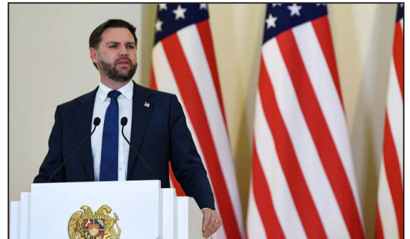
Գախի ռազմաքաղաքական ղեկավարներուն եւ ուր հայ քաղաքացիներու դէմ կայացուած դատավճիռները:

Պաքու մեկնելէն առաջ, Երեւանի «Չուարթընգ» օդակայանին մէջ լրագրողներու հետ զրոյցի ընթացքին Ա.Մ.Ն. փոխնախագահ Ծէյ Տի Վենսը ըսած է, թէ Պաքուի մէջ բանտարկուած հայ գերիներու հարցը քննարկած է Հայաստանի վարչապետին հետ: Պատասխանելով լրագրողի այն հարցումին, թէ արդեօք Պաքուի մէջ եւս պիտի բարձրացնէ հայ գերիներու ազատ արձակման խնդիրը, Վենս ըսած է. «Այդ նիւթը անպայման պիտի բարձրացնենք: Մենք ամուր ու դրական յարաբերութիւններ ունինք թէ՛ Հայաստանի վարչապետին, թէ՛ Ատրպէյճանի նախագահ Իլհամ Ալիեւին հետ եւ իբրեւ այդպիսին, բացի այլ հարցերէ, այս նիւթը եւս պիտի բարձրացնենք, եւ կը կարծեմ, որ պիտի շարունակենք յաջողութեամբ համագործակցիլ թէ՛ ատրպէյճանցիներուն, թէ՛ հայերուն հետ»: Փետրուարի 9-10-ին Ա.Մ.Ն. փոխնախագահ Ծէյ Տի Վենսը պաշտօնական այցով կը գտնուէր Հայաստան, որմէ ետք մեկնեցաւ Ատրպէյճան: